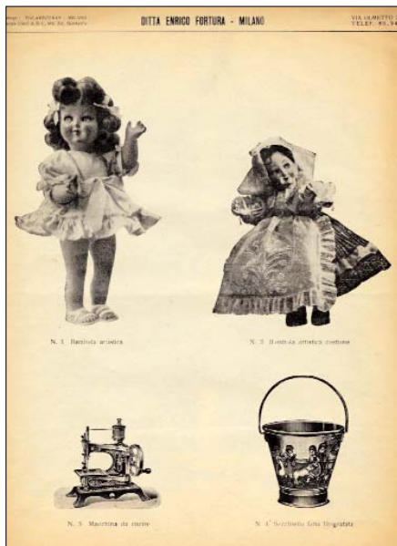
Una pagina del catalogo della Ditta Enrico Fortura (anni Quaranta)

Iniziativa realizzata in collaborazione con il Centro per la cultura d'impresa