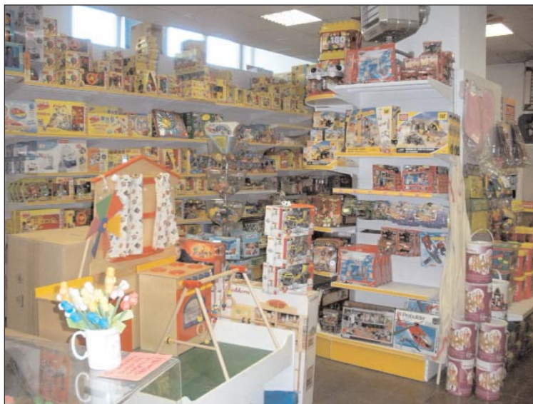
Uno scorcio dell'attuale sede per il commercio all'ingrosso in via Pietrasanta (2008)